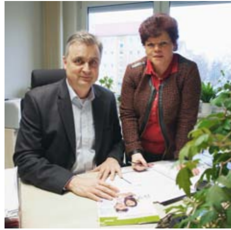
Sehr geehrte Mitglieder, sehr geehrte Wohnungsnutzer,

kennen Sie das wunderschöne Kinderlied von Rolf Zuckowski: