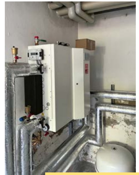
Gustav-Schubert-Str. 18 und 24 – Erneuerung der Heizungsanlage

Wir haben in den letzten Jahren versucht, aus technischer Sicht alle Möglichkeiten auszuschöpfen und somit die gestiegenen Prei-