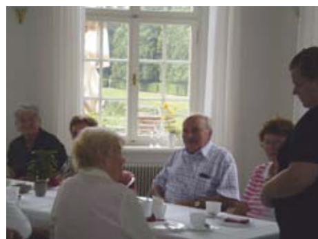
Ein gemütliches Beisammensein gab's an der Kuchen- und Kaffeetafel im Palais.

Viele Mitglieder suchten den Kontakt über die Geschäftsstelle der WGG und ließen sich von mir in sozialen Fragen und Problemen beraten. Oft konnte ich dann ganz spezielle Hilfe anbieten. Gemeinsam füllten wir z.B. die Vorsorgevollmacht aus, beantragten einen Schwerbehindertenausweis, klärten einen Sachverhalt mit der GEZ oder beantragten nach einem Krankenhausaufenthalt eine Haushaltshilfe bei der Krankenkasse. Auch das Beantragen von Pflegestufen bei der Pflegekasse und die Unterstützung bei der Unterbringung eines Familienmitgliedes in einem Seniorenheim gehörten zu den gewünschten Aufgaben.