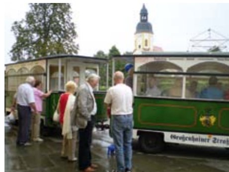
Die Großenhainer Kleinbahn brachte uns gemeinsam nach Zabeltitz.