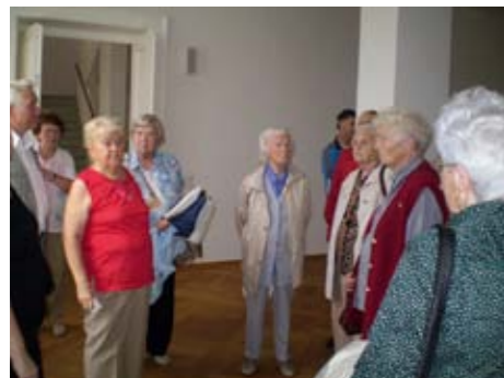
Sehr interessant war der geführte Rundgang durch das Palais, wer wollte spazierte dann noch im Barockgarten.